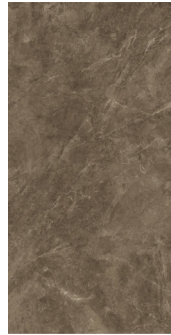
BAYONA P MOKA NATURAL BP2412L