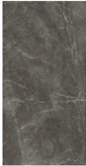
BAYONA P GREY NATURAL BP2412L